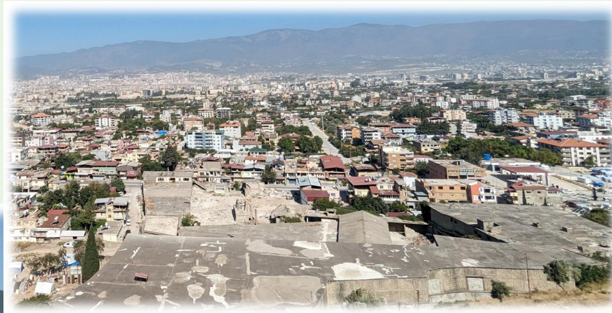
大地震後的安提阿城市 幾乎已經成為廢墟……